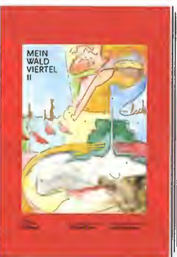
WOLFGANG KÜHN Mein Waldviertel II. Anthologie

Residenz Verlag, Wien, Salzburg 2024, 160 Seiten, Hardcover, ISBN 978-3-7017-1785-9, Preis: € 22,-