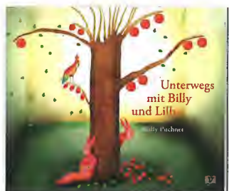
WILLY PUCHNER Unterwegs mit Billy und Lilly

Literaturedition Niederösterreich, St. Pölten 2024, 104 Seiten, Hardcover, ISBN 978-3-90271776-4, Preis: € 20,-