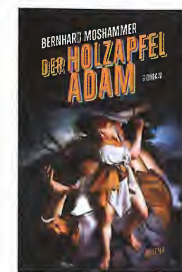
BERNHARD MOSHAMMER Der Holzapfeladam. Roman

Edition Winkler-Hermaden, Schleinbach 2024, 136 Seiten, mit Farbstiftzeichnungen des Autors, Hardcover, ISBN 978-3-9519762-6-6, Preis: € 22,-