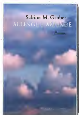
SABINE M. GRUBER Alles gut, am Ende. Roman

Vermes Verlag, Tulln 2024, 72 Seiten, Bilderbuch, Hardcover, ISBN 978-3-903300-91-0, Preis: € 22,-