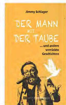
JIMMY SCHLAGER Der Mann mit der Taube ... und andere verrückte Geschichten

Literaturedition Niederösterreich, St. Pölten 2024, 280 Seiten, mit Zeichnungen von Anna Schachinger, Hardcover, ISBN 9783902717-795, Preis: € 24,-