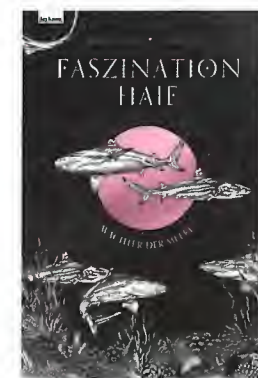
MICHÈLE GANSER, MICHAEL STAVARIČ Faszination Haie. Wächter der Meere

Milena Verlag, Wien 2024, 270 Seiten, Hardcover mit Schutzumschlag, Leseband, ISBN 978-3-903460-27-0, Preis: € 25,-